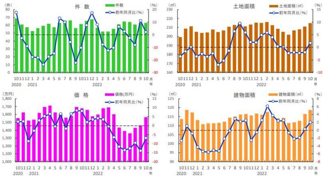
■岡山県 中古戸建住宅の成約状況

成約件数は63件と前年比で2.2%増加し、9月に続いて前年同月を上回りました。平均成約価格は1,563万円と前年比で6.9%下落し、8か月連続で前年同月を下回りました。土地面積は215.0㎡と前年比で1.8%拡大し、5か月ぶりに前年同月を上回りました。建物面積は118.8㎡と前年比で2.0%拡大し、9月に続いて前年同月を上回りました。