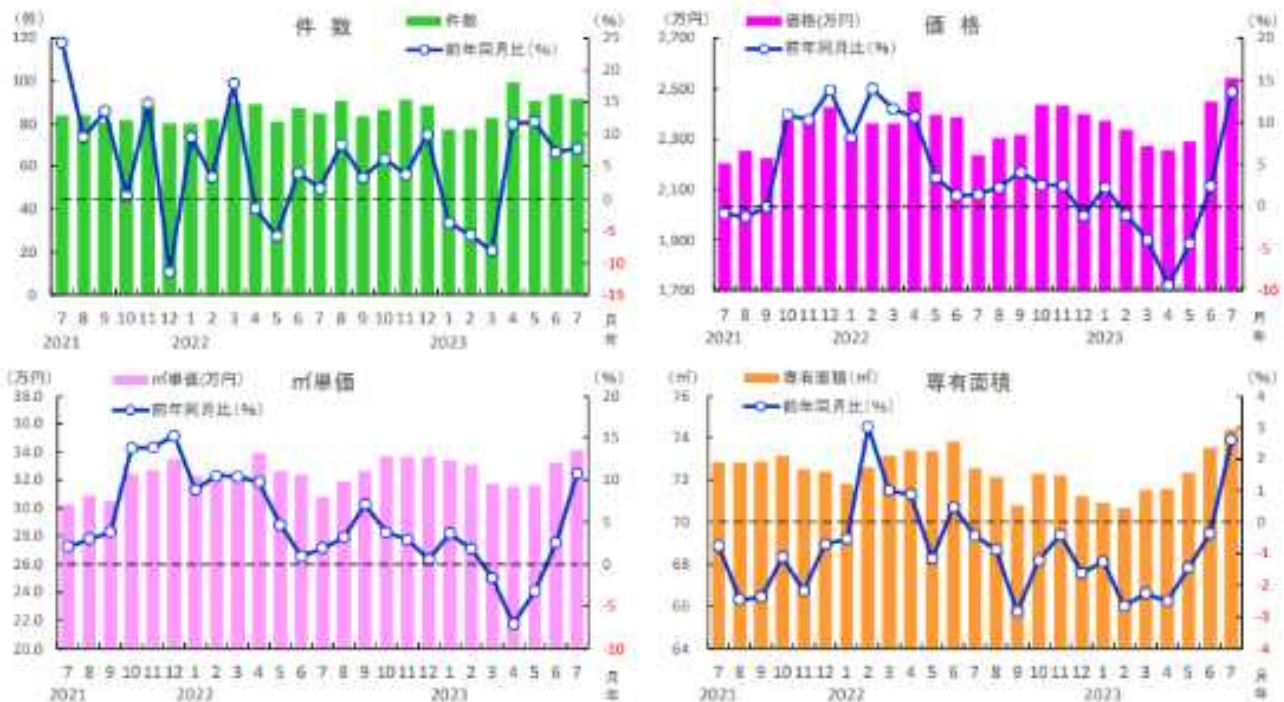
■広島県 中古マンションの成約状況

成約件数は 92 件と前年比で 7.8%増加し、4ヶ月連続で前年同月を上回りました。平均成約㎡単価は 34.1 万円で前年比プラス 10.7%の 2ケタ上昇、成約価格は 2,541 万円で前年比プラス 13.6%の 2ケタ上昇となり、双方とも 6月に続いて前年同月を上回りました。専有面積は 74.4 ㎡と前年比で 2.6%拡大し、22年 6月 以来 13ヶ月ぶりに前年同月を上回る結果となりました。